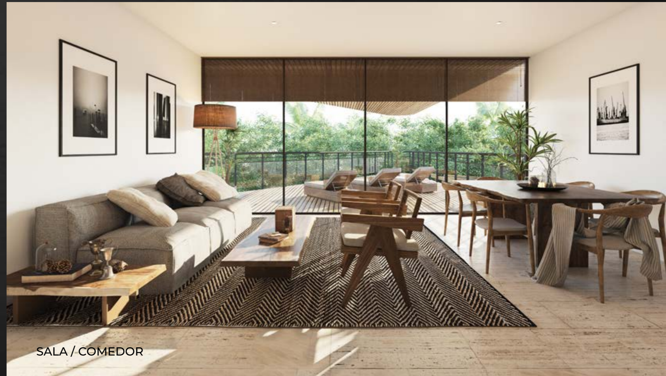
SALA / COMEDOR